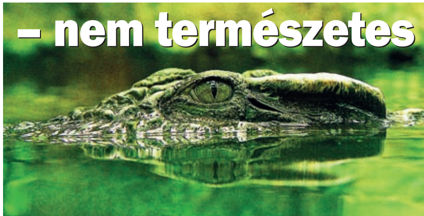
» A krokodilok és az alligátorok lassan, szemüket a vízfelszín felett tartva, észrevétlenül az áldozatuk közelébe úsznak, hogy azután egy gyors támadással megragadják

A világhírű zoológus, prof. Z. Veselovsky pontosított: „ Soha sincs szó két faj véres harcáról... Az élő organizmusok fő mozgatóele-