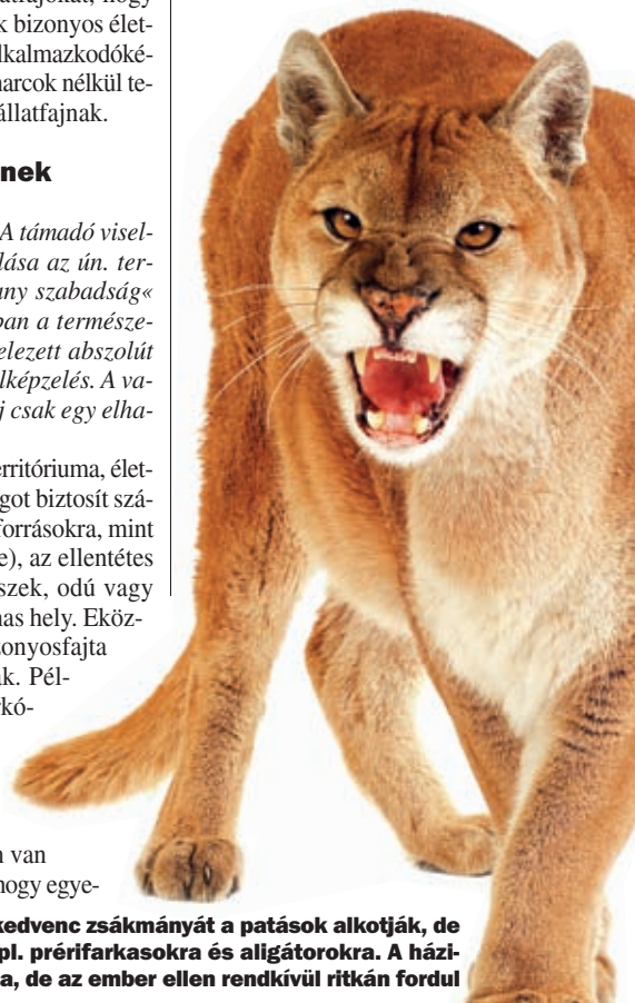
» Az amerikai puma kedvenc zsákmányát a patások alkotják, de ragadozókra is vadászik, pl. prérifarkasokra és alligátorokra. A házi állatokat is megtámadhatja, de az ember ellen rendkívül ritkán fordul

dül, párban, családban vagy esetleg nagyobb csapatban (csordában) él-e. A béka hímjének elegendő egy pocsolya, némely nagyragadozók (pl. a tigrisek) több mint 100 km 2 nagyságú territóriumot is birtokolnak. A nagy szemű és nagy fülű kombómajmok, amelyek általában húsízű csoportokban élnek, olykor 700 km 2 nagyságú területen is tartózkodnak.