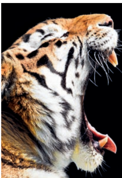
» A tigris hősiességgel védi több mint 100 km 2 nagyságú territóriumát

A tudósok egyelőre 1,5 millió állatfajt ismernek. Többségük rendelkezik a védekezés és gyakran a támadás képességével is. Kína keleti részén nemrég egy teknősfajt fedeztek fel, amiről korábban azt hitték, hogy már kipusztult. Az Eaglemount nevű teknős már 500 éves. A 80 cm hosszú és 11 kilogramm súlyú állat hatalmas fejvel és tuskés páncéllal rendelkezik. Olyan agresszív, hogy mindenkit megtámad, aki csak a közelébe lép. »