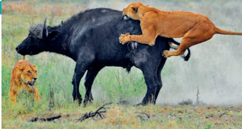
» Nöstény oroszlánok bivaly vadászat közben. A tudósok szerint, ezek a macskaféle ragadozók csupán próbálkozásaik alig egyharmadában sikeresek

A mászor békeszerető állatok viselkedése is megváltozhat, és hirtelen agresszívvé válhatnak. Idén februárban ez történt a szelídített, Keiko nevű kardszárnyú delfinnel, a Szabadítsátok ki Willyt című film híres főhősével.