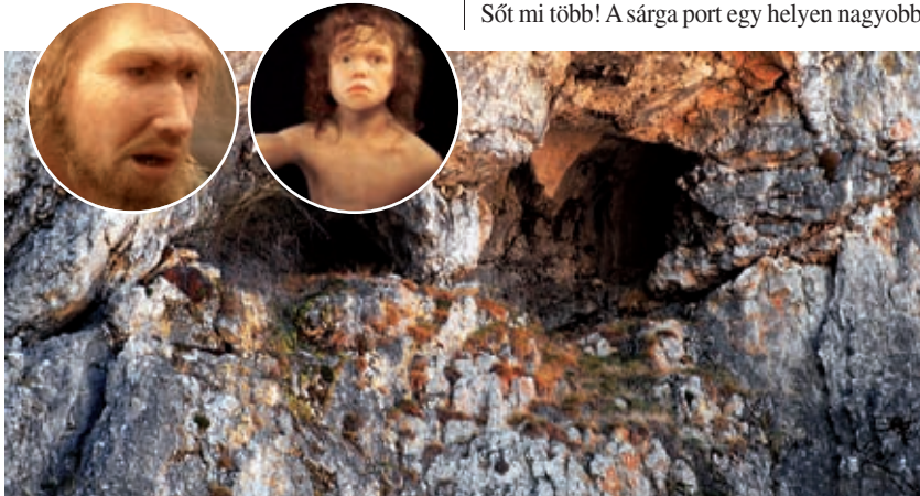
» A Cueva de los Aviones és a Cueva Antón barlangot a legújabb kutatások szerint 50 000 évvel ezelőtt Neander-völgyiek lakták

A Homo sapiens és a Neander-völgyiek evolúciós vonala minden információ szerint 370 000 évvel ezelőtt szakadt ketté. Amíg közvetlen őseink hosszú ideig Afrikában maradtak, ahol kifejlődtek, a Neander-völgyiek „elfoglalták” Európát és a Közel-Keletet. De szó sem lehet valódi elfoglalásról. A németországi Lipcseben lévő Max Plank Intézet evolúciós antropológia részlegének legújabb genetikai ismeretei szerint a Neander-völgyiek sosem voltak túl sokan – mindegyikük gond nélkül elfért volna egy mai futballstadionban. A Homo sapiens faj Európába való érkezése után, ami a tudósok szerint 45 000 évvel ezelőtt történt, kegyetlen idők jöttek el a Neander-völgyiek számára. Rokonai nem éppen kedves viselkedésének köszönhetően a már amúgy is kis létszámuk még tovább csökkent. Végül az utolsó menedékhely a Pireneusi-félsziget térsége vált számukra, ahonnan véglegesen 37 000 évvel ezelőtt szorították ki őket. Délkeleten, a Murcia térségé-